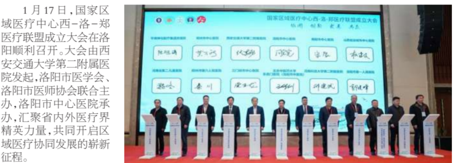
医疗中心 西-洛-郑 医疗联盟成

1月17日,国家区域医疗中心西-洛-郑医疗联盟成立大会在洛阳顺利召开。大会由西安交通大学第二附属医院发起,洛阳市医学会、洛阳市医师协会联合主办,洛阳市中心医院承办,汇聚省内外医疗界精英力量,共同开启区域医疗协同发展的崭新征程。